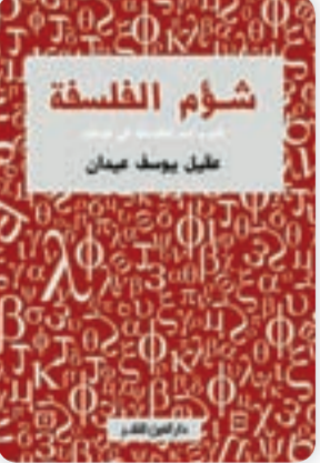
● غلاف الكتاب

الاسلام أين ما ذهبوا وحيثما حلوا فحسب، بل كان يطاردهم خلال حياتهم وبعد وفاتهم أيضاً!