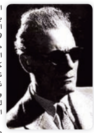
● الأديب طه حسين

في عام 1942، أصبح مستشاراً لوزير المعارف ثم مديراً لجامعة الاسكندرية حتى احيل للتقاعد في 16 أكتوبر 1944م واستمر كذلك حتى 13 يناير 1950 عندما عين لأول مرة وزيراً للمعارف. الف طه حسين العديد من الاعمال، وكانت هذه الاعمال الفكرية، هذا بالإضافة لتقديمه عدد في الروايات، والقصة القصيرة، والشعر ومن أعماله «الأيام»، عام 1929 كما قام بترجمة عدد من المؤلفات الهامة إلى العربية، وترجمت مؤلفاته هو شخصياً إلى عدد من اللغات، وله العديد من البحوث توفي طه حسين في 28 أكتوبر 1973م، وهو نفس العام بل نفس الشهر الذي حققت فيه مصر انتصارها بعبر قناة السويس، واسترداد اراضيها من براثن الاحتلال الاسرائيلي.