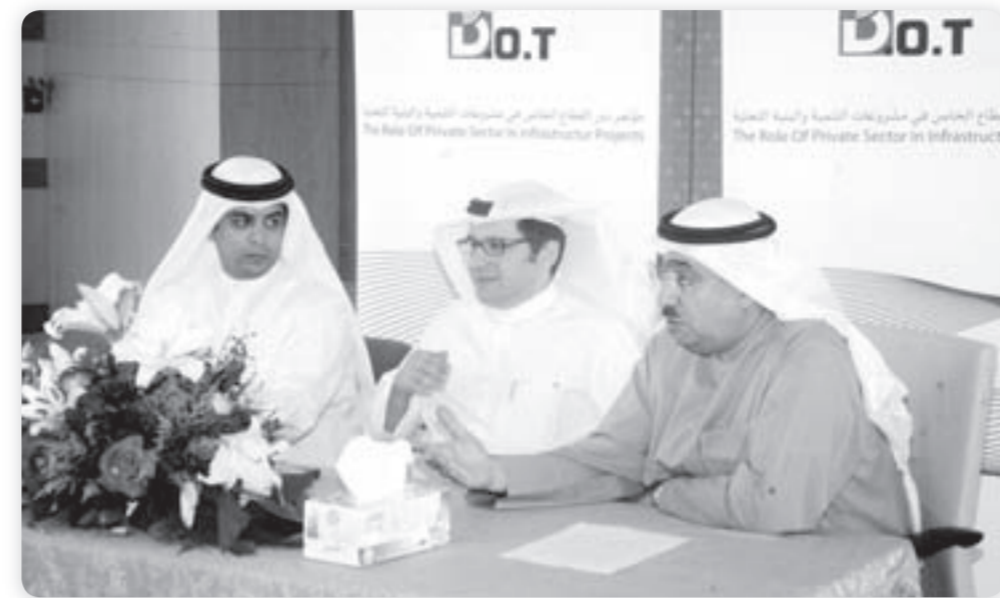
• جانب من المؤتمر الصحفي للشركة

سبلات تحتاج إلى علاج وأضاف الجراح أن الأزمة الاقتصادية التي تربطها البلاد تحتاج إلى تضامير جهود السلطتين التشريعية والتنفيذية بهدف سرعة إنجاز التشريعات الاقتصادية المحركة لنشاط القطاع الخاص ومعالجة